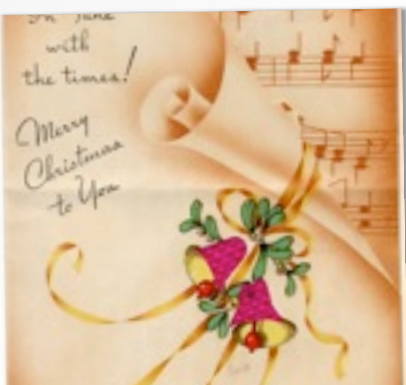
FIESTA DE NAVIDAD

3º ciclo (alumnado de 5º y 6º de primaria): martes 18 de diciembre a las 17.00 h.