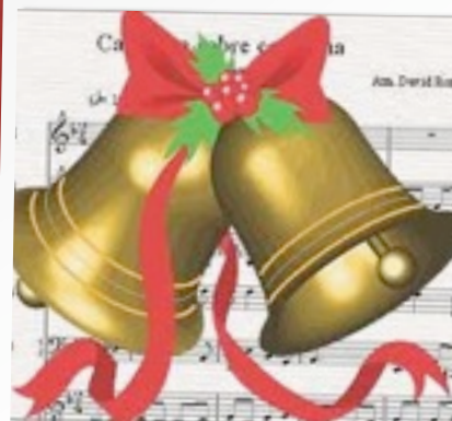
VI CERTAMEN LITERARIO DE NAVIDAD